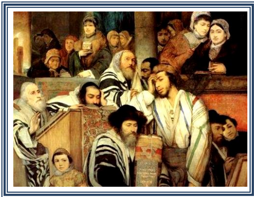
ציור : מאוריצי גוטליב