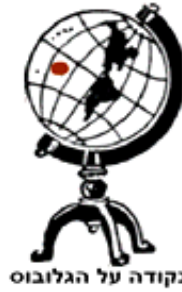
נקודה על הגלובוס