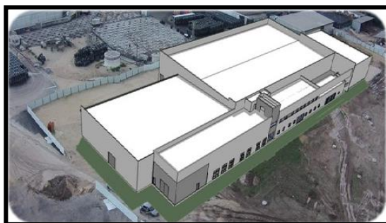
הדמיה של אולם הייצור החדש