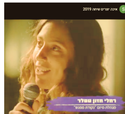
מתוך סרטון של העמותה