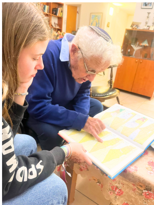
מעיינים יחד באטלס

אני מנסה להבין משתי הבנות מה "הסוד" של החיבור שנוצר.