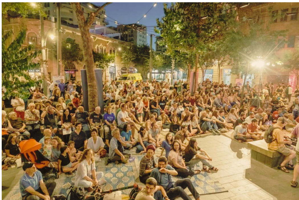
מעגלי שיח במיזם "איכה"

מה שאני יודעת הוא שכל יום שעובר ממחיש את הצורך והחשיבות של 'דרך שירה בנקי' כארגון חינוכי משמעותי שמנסה לפעול גם, אולי בעיקר במקומות החיכוך והמחלוקת הקשים ביותר לחברה הישראלית, לשתף ולהדהד את מה שיקדם הידברות, פשרה והבנה.