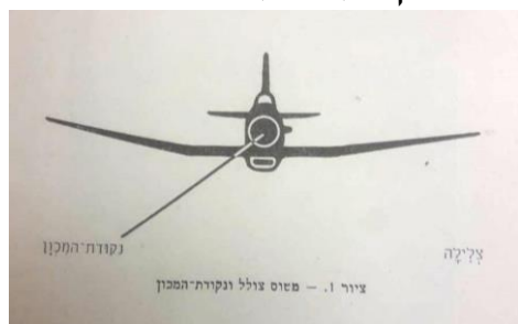
צילום מתוך חוברת על יירוט מטוסים מ-1945. נמצא בארכיון קב' יבנה.