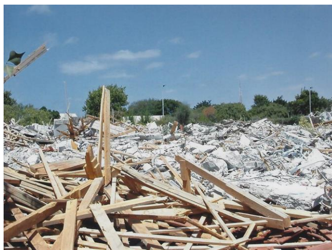
בית משפחת בטר בנווה דקלים