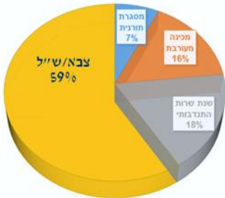
הכוון בנות תשע"ט