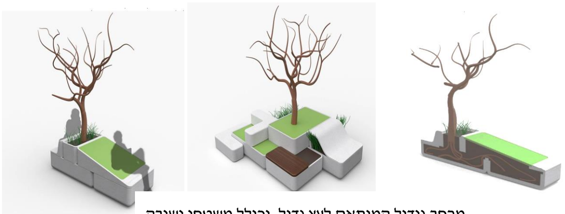
מרחב גידול המותאם לעץ גדול, וכולל משטחי ישיבה

בימים אלה, לאור צבר ההזמנות נערכת החברה ליצור סדרתי של המוצר.