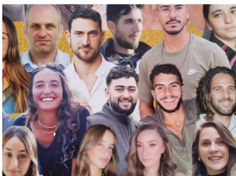
חלק מתוך כרזה באתר הנובה

שוב אנחנו חוזרים ומזמינים את כל המעוניינים להצטרף אלינו לירקונים. המעוניינים - יכולים לפנות אלי ואצרף אותם לרשימת התפוצה.