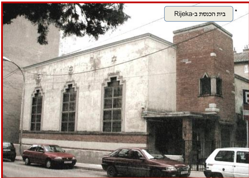
בית הכנסת ב-Rijeka