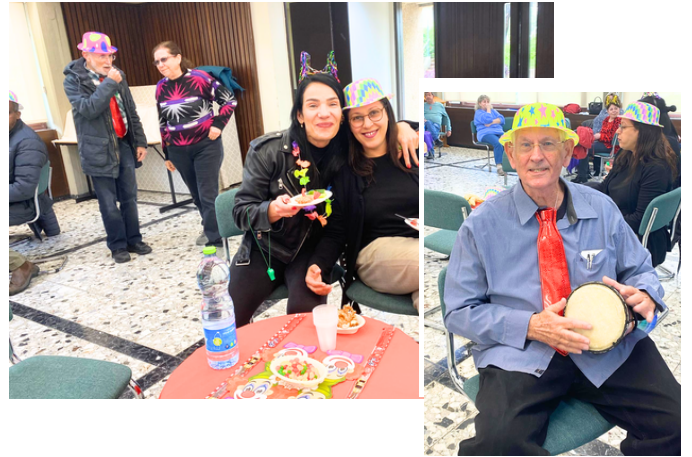
במגלריה - אירוע פורים משולב בפרידה מפייני רטרי, "האיש של המגלריה הצפון" לאחר 32 שנות צבירה.