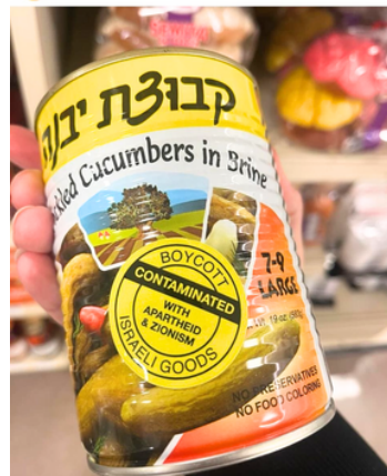
צ'פיה באינסטלרם: משפחה ישראלית בירל' ינה, ארה"ב, נכנסה לקונט מלפפונים חמוצים מישראל ונתקלה בצה. על המדבקה הצהובה רשום: "מחרימים סחורה ישראלית שמצוממת באפרטהייד וציונות".