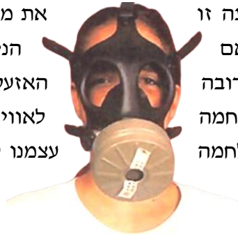
כל דור והמסכה שלו