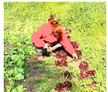
חברים באו לקטיף ראשון של חסה מסולסלת. מערוגות משק הילדים היישר לשולחן השבת.