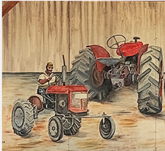
פרט מתוך ציור הקיר שליד סככת התפוחים. על הטרקטור: רמי. ציירו דני הרץ ואפרת עפרוני

אור המגדלור נחלש נצנוץ מרחוק כוחו תש נסיון אחרון להזכר בצחוק בכאב לא יותר הימים עוברים וחולפים ואנחנו עדין שואלים האם משהו נותר ממנו ילדיו נכדיו ניניו בכלנו. "תעשו עד הסוף... או שלא תעשו בכלל" צוה לנו כמורשת על. נאחזים בזכרון שמבלבל מרגיש צרה להתנצל לא בטוח שמספיק זוכר הכל מתערבב מתערער. נבקש שקט וקצת נחמה נודה בטוב... יש על מה סמוך ובטוח שגשאר משהו מהאיש היקר ע.ע.