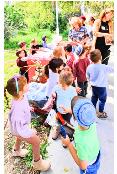
ילדי גנון דקל מגלים עולמות, ומעשירים את חצר הגרוטאות בשוק "קח תן". (וכל הכבוד לקרן אור, על הפקת השוק!)