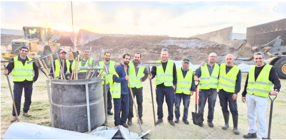
מבצע כיסוי בורות התחמיץ - בתמונת סיום העונה. הגיבושון האולטימטיבי!!!