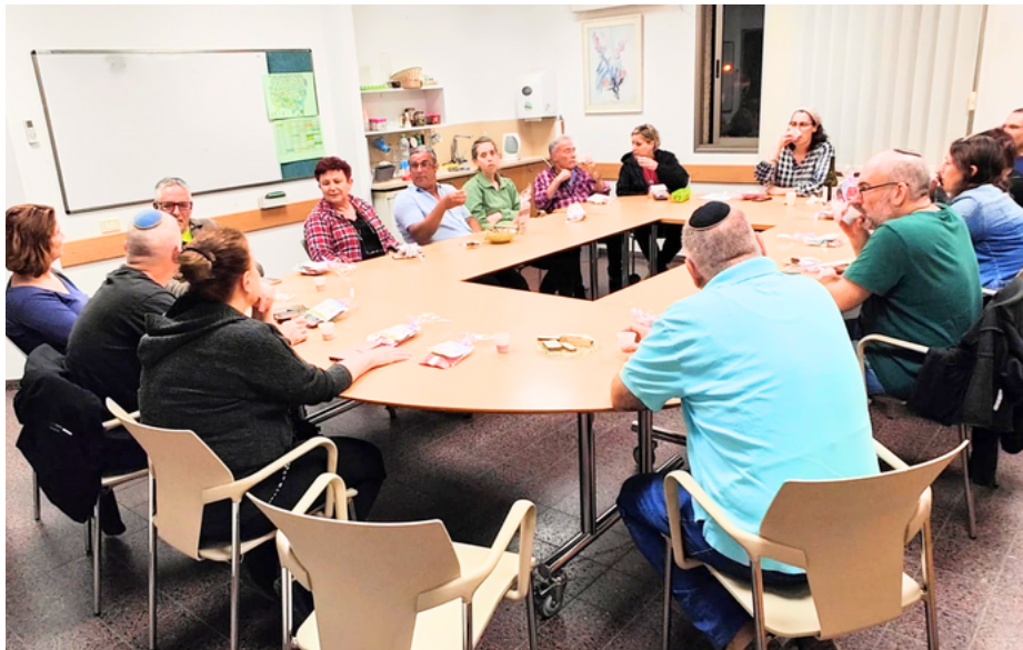
אז מה הנרטיב של הקיבוץ? זאת השאלה שנשאלו ראשי הצוותים בקיבוץ בעת הרמת כוסית לכבוד החג במסגרת פעילות אגף חברה ופרט. גילינו שכוחנו בעשייה, או כמו שמיתגה את זה חמוטל "אמור מעט ועשה הרבה".