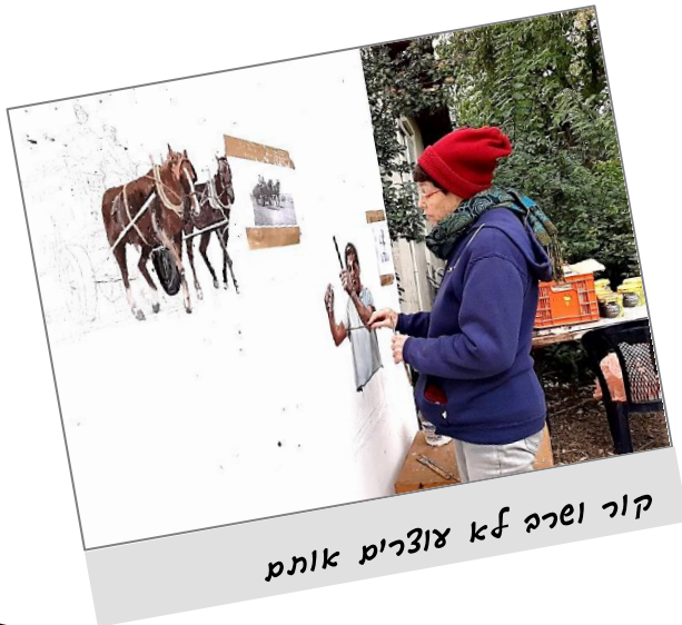
קור ורפא לא צוצריס אתם

בקרוב יוצב השלט המתאר בקצרה את תולדות הענף ועובדיו.