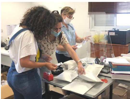
בשירות לקוחות, התגייסות משלוח השעונים

מאז שפתחנו, אחרי הסגר - אין הווי. יש טרפת. הטלפון מצלצל כל הזמן. עובדי החנות לא יושבים בנחת לרגע, בקושי הפסקה לארוחת צהריים. השענים כמעט לא מספיקים לעשות את התיקונים המצטברים,