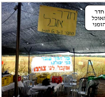
חדר האוכל הזמני

ביקשתי מיאיר לסלוי , מנהל בית הספר התיכון כמה מילים על הקמת הקיבוץ, כמעט מפעל חיים עליו חוזרים מידי שנה בשנה שכבות י"ב לדורותיהם: