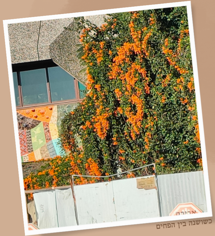
כשושנה בין הפחים