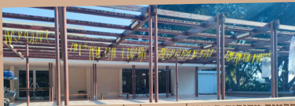
סרטים צהובים בפרגולה, בתפילה להשבת החטופים