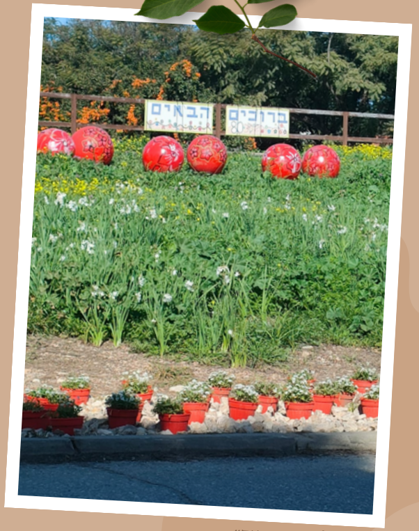
מחווה ל"דרום אדום"