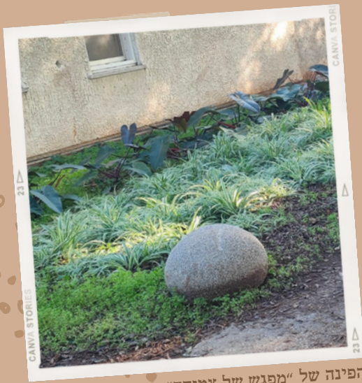
הפינה של "מפגש של צמיחה"