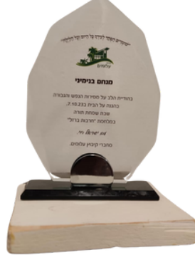
מגן שכל לוחם מכיתת הכוננות קיבל בערב הוקרה

אסנת: אני הבנתי רק ביום ראשון כשהגענו לפרדס חנה. אנשים הביאו לנו המון תרומות ומתנות ומשחקים לילדים. לא הבנתי למה. ומשם למעשה אני מתחילה להבין. באותו בוקר היינו עסוקים באיך לשרוד את היום הזה.