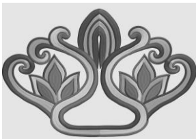
יצחק (גיינג'י) לנג

הוא קשה יותר ליישום, אבל נוכל לו אם נדע לאהוב .