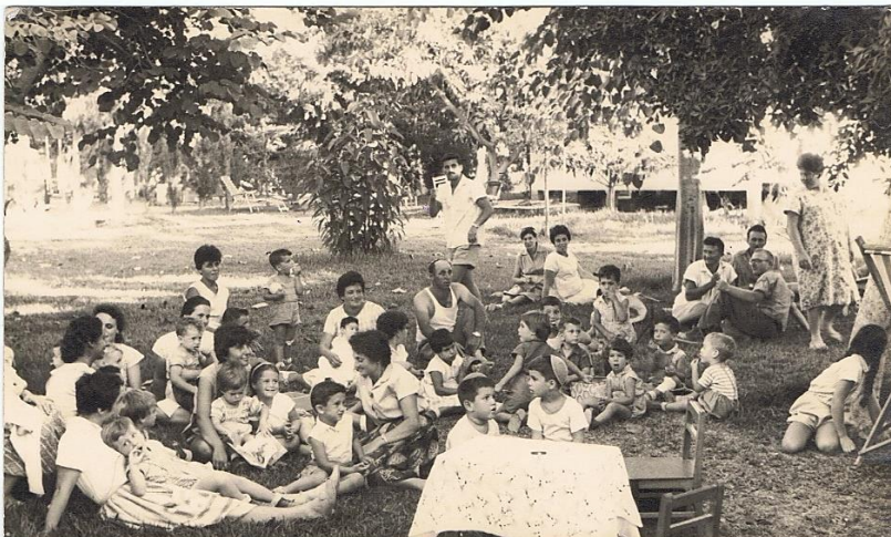
קומזיץ עציונים וילדיהם 1962.

קליטת הגרעין בקבוצת יבנה היתה הצלחה גדולה. תרומתם של חברי הגרעין לקבוצה התבלטה בכל תחומי החיים. יבנה עם העציונים היתה בלא ספק שונה מזו שהיתה עד בואם של העציונים. משימתו החשובה של הגרעין – להקים רצף דורות - הושגה ובכך הביאה לחיזוקה ושגשוגה של קבוצת יבנה.