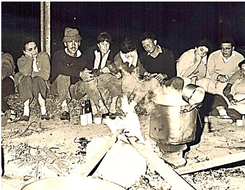
קומזיץ עציונים 1963

לכולם היה ברור שיבנה זקוקה בדחיפות להרבה "דם צעיר". גרעין עציון היווה פוטנציאל מתאים שמגיע ממש בזמן הנכון, ואנשי יבנה פתחו מיד, בעוד הגרעין משרת בנח"ל, במערכת יחסים קרובים ואפילו