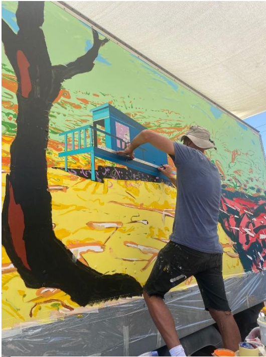
ניתן לצפות בתמונה בצבע - בדף הפייסבוק של מתן, או בגיליון מבית באתר יבנט (מופיע ב"קבצים")

במהלך היצירה, ביקרו אותי בצריפין ההורים שלי וגם ילדיי, כדי לראות את הרקע לעבודה שלי. אמא כל הזמן התעדכנה והראיתי לה תמונות, וגם באתי יום אחד לנוח בקיבוץ, בצהרים. לכל אורך הדרך שלי, כאמון, ההורים שלי תמיד תומכים ונמצאים בשבילי בפתיחות, ומעורבים. ממש כיף ולרגע ולא מובן מאליו!