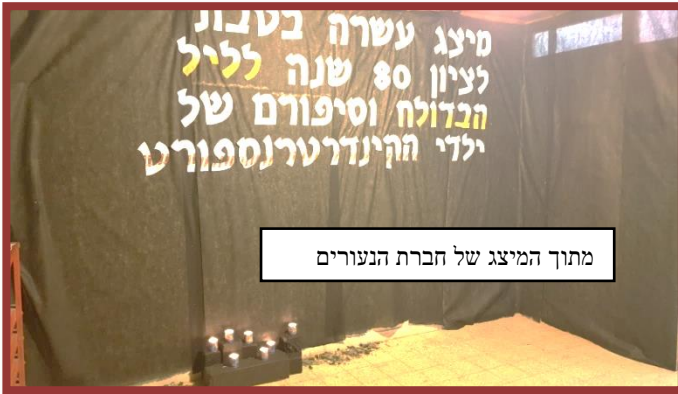
מתוך המיצג של חברת הנעורים

אבי, לאחר כל מה שעבר - בחר בחיים, לא סיפר דבר. הוא אחז בנר הזיכרון אך נצר אותו בלבבו פנימה.