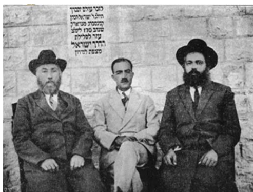
מנהיגי הקהילה עם המושל הבריטי ליד לוח האבן של "דרך ישראל" ביום פתיחת הדרך