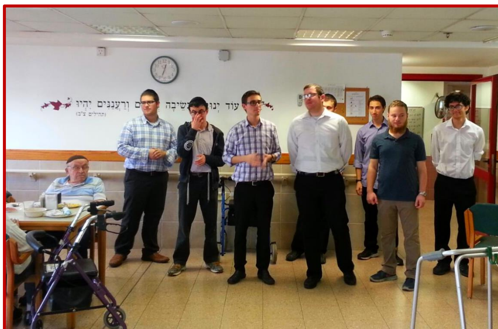
נעים זמירות ישראל

זמירות בבית סביון. הוא מדבר על החוויה, על האהבה שהוא מקבל מהקהל, מדיירי בית סביון והעובדים. הוא מדבר על היציאה מבועת הישיבה לצורך נתינה, עשייה בעלת משמעות ... לדבריו הם לא צריכים להתאמן. השירה בוקעת מתוכם, צומחת מתוך הזמירות בארוחות השבת בישיבה. בשורה אחת הם נעמדים ושרים ומטבלים בוורט קטן לפרשת השבוע. וכעבור זמן הם כבר בדרכם לישיבה וחוזר חלילה בכל שבוע ... חוץ מ"בין הזמנים".