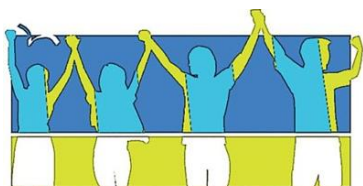
חברים בטבע - העצמה קהילתית (ע"ר)

במסגרת היכרות עם צמותת 'חברים בטבע' הכריזו באדירה נדחה עקב המצב הביטחוני וצדקת צדקה ווצדקת תרבות