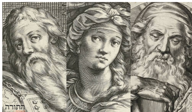
דיוקנאות אהרון, מרים ומשה (פרט), ג'ייקוב מאת'ם וקורנליס גלה, תחילת המאה ה-17 לערך.

את תשובת אהרון ניתן לנסח במילים המוכרות לנו היטב מהתקשורת העכשווית: לא אני עשיתי את העגל! אני רק ביקשתי זהב, הם נתנו, והעגל נעשה מאליו. ומבאר הרב זקס: "זה אותו סוג של התכחות לאחריות שאנו זוכרים מסיפור אדם וחוה. 'זו היא, זה הוא - זה לא אני'. דהיינו: זו היא (האשה), זה הוא (הנחש) - זה לא אני