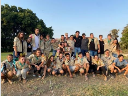
שכב"ג שבט מידב