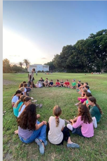
מידב גדוד ד', הראשג"ד יובל אפרתי