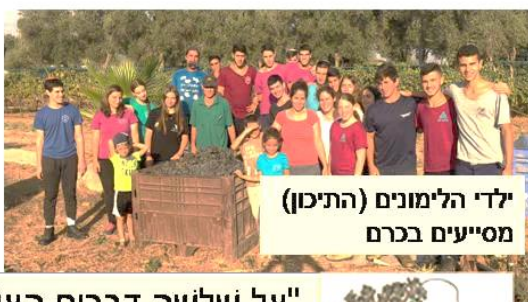
ילדי הלימונים (התיכון) מסייעים בכרם

"על שלשה דברים העולם עומד, על התורה ועל העבודה ועל גמילות חסדים." (מסכת אבות א', ב')