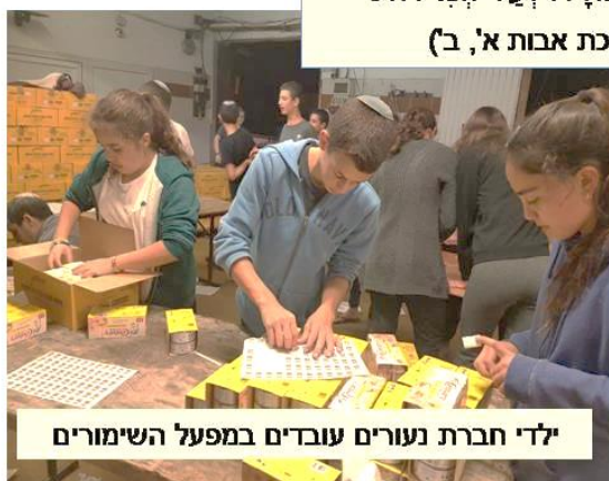
ילדי חברת נעורים עובדים במפעל השימורים