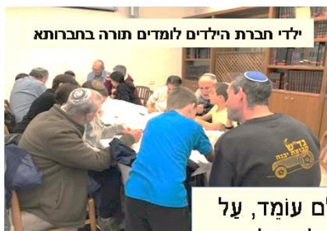
ילדי חברת הילדים לומדים תורה בתחרותא